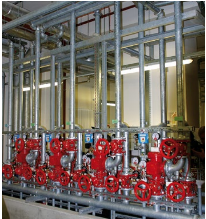
Sprinkleranlage der Allianz Arena München.