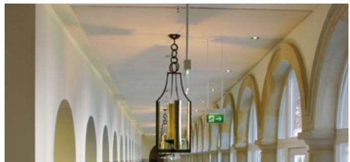
Feuerschutz durch Sprinkler in der Villa Kennedy, Frankfurt.

Eine Vielzahl von Hoteliers und Gastronomen haben die Gefahr des hohen Brandrisikos erkannt und investieren in effektive Brandschutzmaßnahmen. In welchen Hotels die Sicherheit der Gäste oberste Priorität hat, erfahren Sie auf der Homepage des bvfa. Dort sind nicht nur alle Hotels aufgelistet, die bisher mit Sprinkler Protected ausgezeichnet wurden und über einen Vollsprinklerschutz verfügen, sondern auch Hotels, die zumindest durch eine Sprinkleranlage teilgeschützt sind.