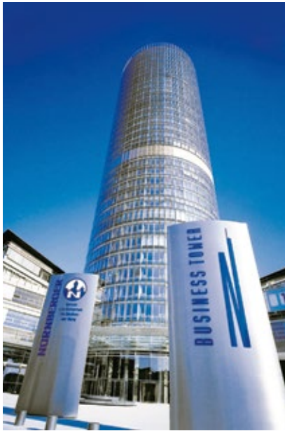
Business tower, Nürnberg.